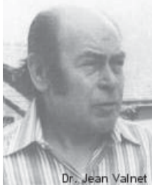
Acima fotografias de Gattefossé e de Jean Valnet, criadores da aromaterapia na França.